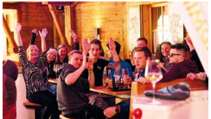
Ausgelassene Stimmung nach den Challenges: Das abwechslungsreiche Programm wurde mithilfe der Schladminger Event- und Outdoor-Agentur IN A TEAM und Event Thaler organisiert.