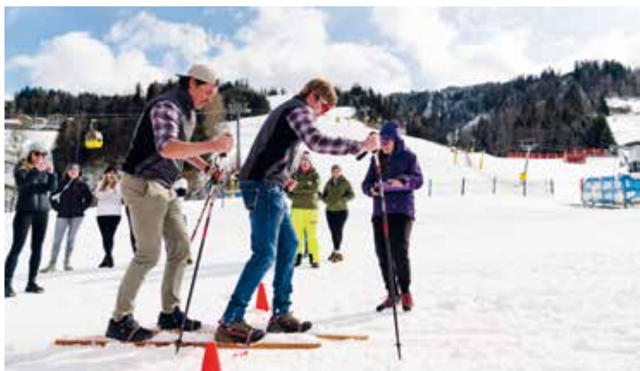
Riesenskifahren will gelernt sein.