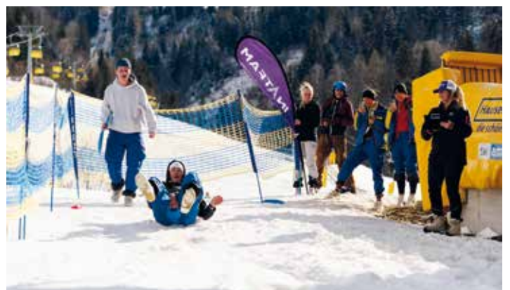
Action beim Bobfahren: Insgesamt 31 teilnehmende 2er-Teams aus Tourismusbetrieben der Region Schladming-Dachstein trafen sich in der AlmArena in Haus im Ennstal zur großen Challenge "Helden der Saison".