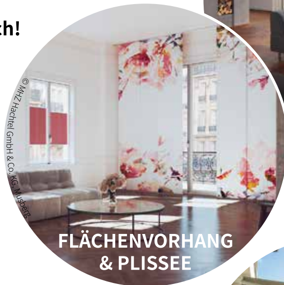
FLÄCHENVORHANG & PLISSEE