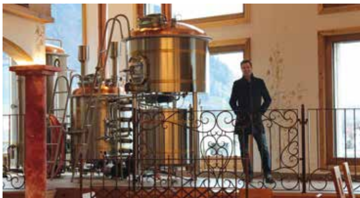
Horseshoe Braui Oberath (CH)