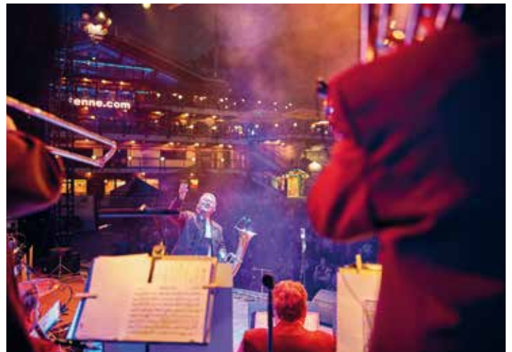
Ernst Hutter und die Egerländer Musikanten.

Und alle teilen unsere Werte der guten Laune auf höchstem Niveau, der Heimatverbundenheit und der Authentizität in allem was sie umtreibt.