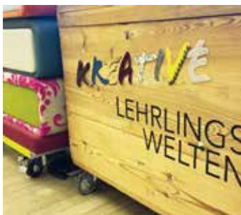
Kreative Lehrlingswelten Haus

Damit wir auch in Zukunft gut aufgestellt sind, liegt es uns besonders am Herzen, junge Menschen für einen Handwerksberuf zu begeistern. Auch in diesem Jahr waren wir beispielsweise wieder bei den Kreativen Lehrlingswelten in Haus und auf der BuK.li in Gröbming vertreten und durften Schüler:innen des Poly Schladming in unseren Partnerbetrieben begrüßen. Zahlreiche Jugendliche nutzten die Gelegenheit, in die verschiedenen Bereiche hineinzuschnuppern. Es freut uns sehr, dass wir 2022 elf neue Lehrlinge in acht verschiedenen Lehrberufen willkommen heißen dürfen. ■