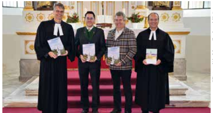
Reformationsfest mit Festschrift Vorstellung.