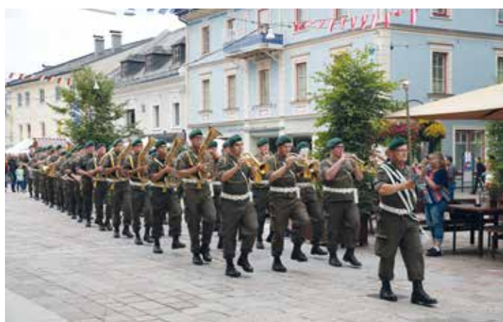
TATTOO - Die Marschshow.