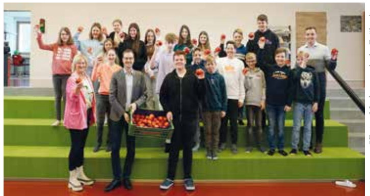
Die Schülerinnen und Schüler der Mittelschule Gröbming freuen sich über den Vitaminstoß.

E inmal im Schuljahr wird die sogenannte „Apfelaktion“, ein gefördertes Schulprogramm der AMA bei der jedes Kind eine Woche lang täglich einen Apfel erhält, von der Marktgemeinde Gröbming durchgeführt.