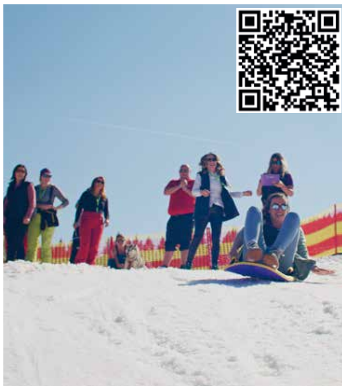
Beim Schladming-Dachstein Teamevent „Helden der Saison“ steht Spiel und Spaß an erster Stelle.

Für den Wettbewerb werden Zweier-Teams gesucht. ■