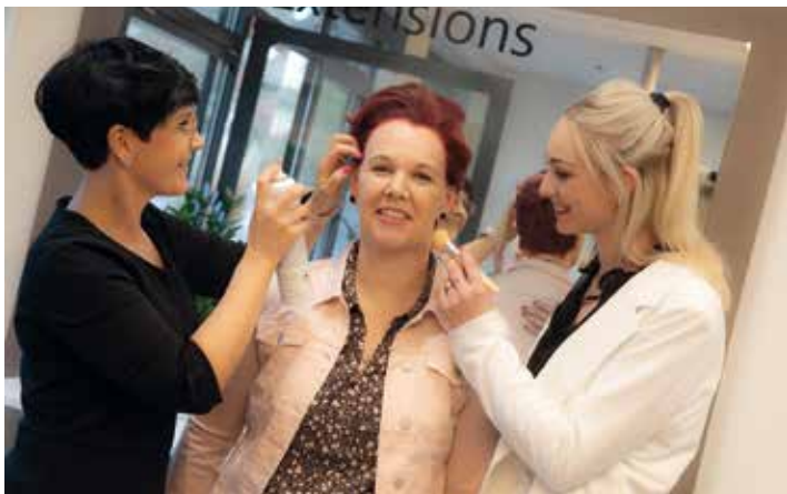
Umstyling durch Color Cut & Style und Hufschmiede.

B ei der Präsentation der Brillentrends 2023 beteiligten sich auch sechs unserer Mitgliedsbetriebe mit einer großen Modenschau und einem Umstyling: LongInStyle, Bründl Sports, Steiner1880, Menz Modetrends zeigten die neusten Trends auf dem Laufsteg. Color Cut & Style und Hufschmiede stylten um.