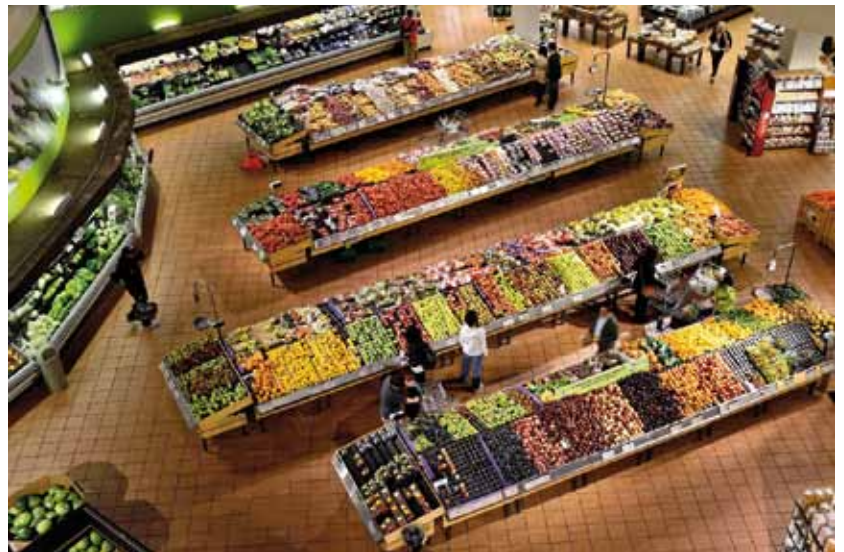
Ein heilloses Überangebot an Lebensmittel. Wer soll das alles kaufen?