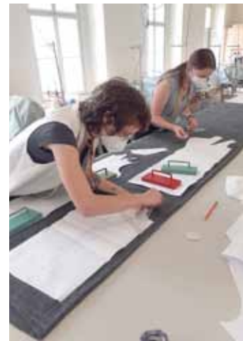
Schülerinnen der HLM HLW Krems beim Zuschnitt.