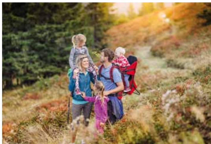
Wichtig ist die Tourenausswahl passend zum eigenen Können.

angegeben wird, da für solche Touren ohnehin von einem notwendigen Maß an Trittsicherheit, Schwindelfreiheit, sehr guter Kondition und oft auch Erfahrung im alpinen Gelände, ausgegangen wird.