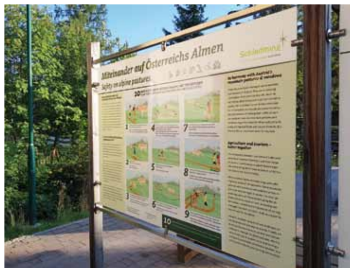
Wanderportale Rohrmoos mit Hinweis zum Verhalten mit Weidetieren.

Tourismusverband Schladming www.schladming.com