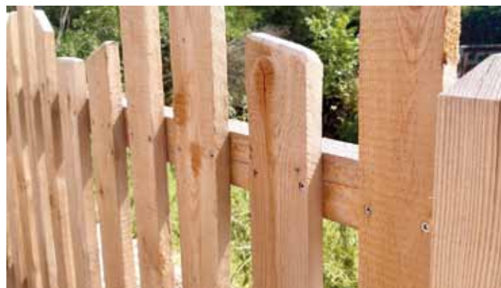
Sieht gut aus und ist ökologisch höchst sinnvoll, der Holzzaun.