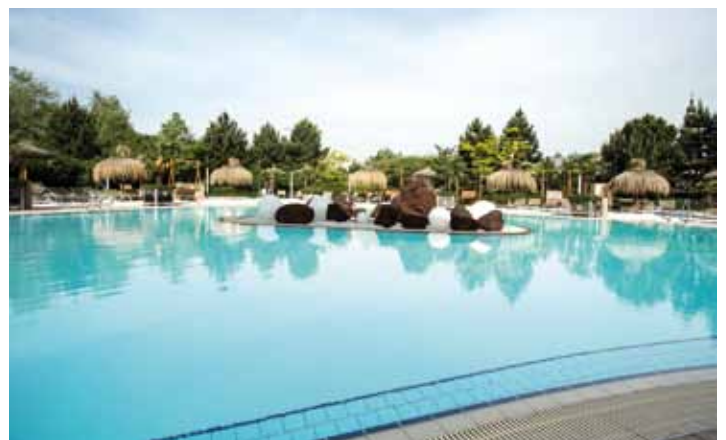
Ein Hauch von Karibik in der Therme Geinberg.