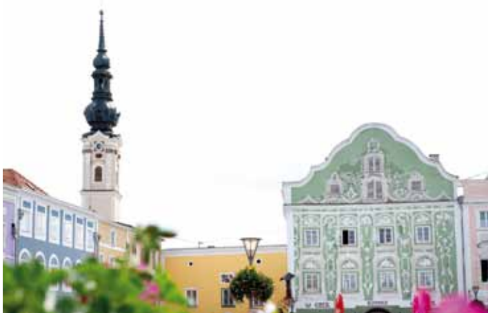
Der malerische Marktplatz von Obernberg.