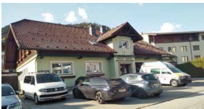
Rot-Kreuz Ortsstelle Schladming

Die Mitarbeiter*innen der Ortsstelle waren und sind nach wie vor in hohem Ausmaß durch den Einsatz in der Teststraße im Congress Schladming gefordert. Der Betrieb wird hauptverantwortlich vom Team des Roten Kreuzes unter der Leitung des Dienstführenden Norbert Pichler abgewickelt. Die Teststraße ist von Montag bis Samstag jeweils von 08.00 bis 18.00 Uhr geöffnet und steht nach voriger Anmeldung über die Website www.steiermarktestet.at der Bevölkerung unentgeltlich zur Verfügung. Diese Einrichtung wird erfreulicherweise sehr gut angenommen – an Spitzentagen werden bis zu 900 Testungen vorgenommen. Das Team des Roten Kreuzes vollbringt im Rahmen dieses nicht alltäglichen Einsatzes großartige Leistungen für die Bewohner